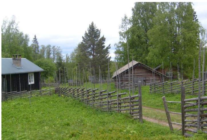
Vy från Julingvallen

Om du använder rast- och övernattningsstugor, vindskydd och torrtoaletter – lämna platsen i det skick du själv vill finna den och ta med dina sopor. Tänk också på brandfaran och elda bara vid därtill avsedda platser när det inte råder eldningsförbud.